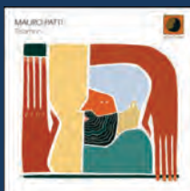
MAURO PATTI "Telamon"