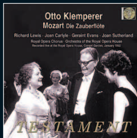
KLEMPERER dirige MOZART DIE ZAUBERFLÖTE R. Lewis, J. Carlyle, G. Evans, J. Sutherland Orchestra & Chorus of the Royal Opera House TES1504 (2 CD)