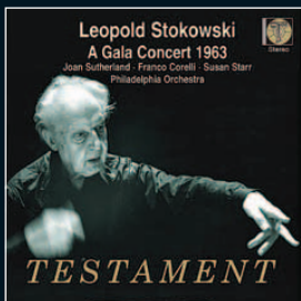
LEOPOLD STOKOWSKI A GALA CONCERT 1963 J. Sutherland, F. Corelli, S. Starr Philadelphia Orchestra TES1513

Le prophète J. McCracken, R. Scotto, M. Home, J. Hines, J. Dupouy, C. Du Plessis, J. Bastin; Ambrosian Opera Chorus , Royal Philharmonic Orchestra , dir Henry Lewis ... 3 101