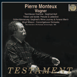
PIERRE MONTEUX dirige WAGNER Concertgebouw Orchestra Live at the Kursaal, Scheveningen, 1963 TES1507 (2 CD a prezzo speciale)